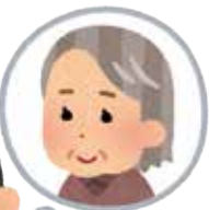
地域福祉コーディネーター