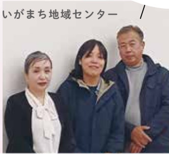
いがまち地域センター