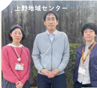
上野地域センター