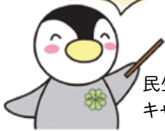
民生委員・児童委員 キャラクター ミンジー

民生委員・児童委員の大切な役割は、地域の人たちの困りごとをすばやくキャッチして、専門機関や必要な福祉サービスなどに「つなぐ」ことなんだ。そのために、行政や市町社会福祉協議会の職員などと連携して、次のような活動を行っているよ。