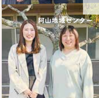
阿山地域センター