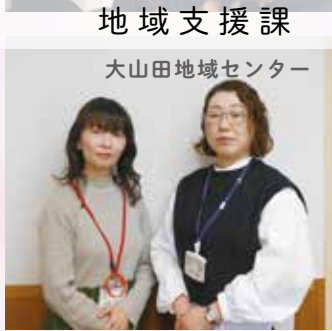
大山田地域センター