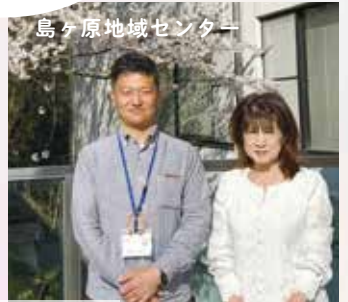
高ヶ原地域センター