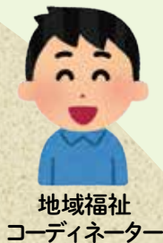
地域福祉 コーディネーター

災害時、配慮が必要な人が取り残されないよう、防災活動や近隣のつながり強化のお手伝いをしています。