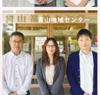
青山地域センター